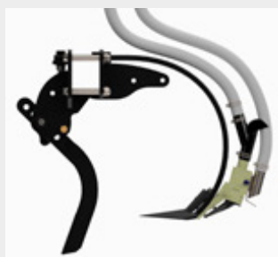
Tylna redlica nawozowa (umieszczenie nad nasionami)

Dozowanie nawozu jest dostępne we wszystkich szerokościach maszyn w gamie siewników ciągnanych. Dostępne jest również w siewnikach zawieszanych dzięki podwójnym zbiornikom lub poprzez zastosowanie przedniego zbiornika.