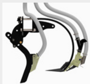
Przednia redlica nawozowa (umieszczenie pod nasionami)