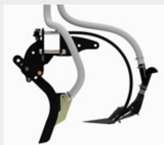
Podzielone redlice nawozowe (umieszczenie nad i pod nasionami)