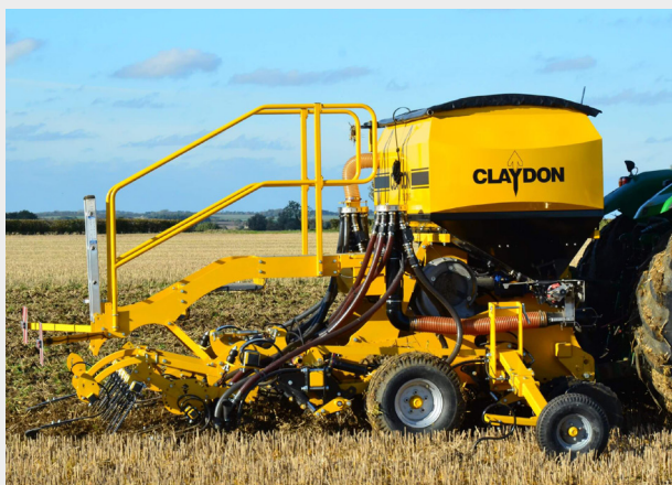
3 m zawieszany Evolution M3F