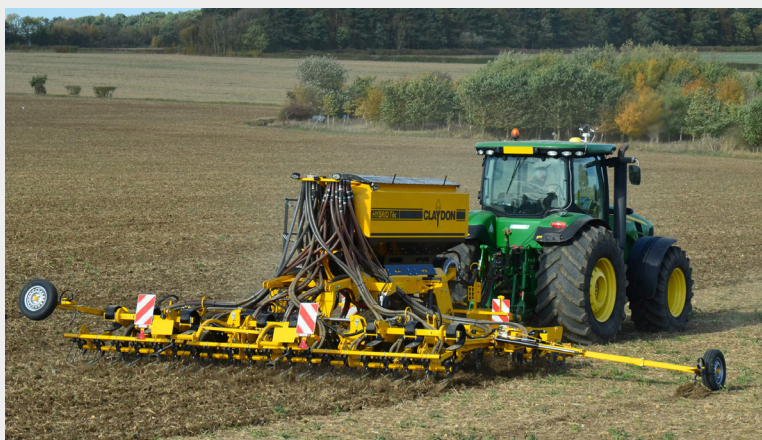
6 m ciągnany Hybrid T6c